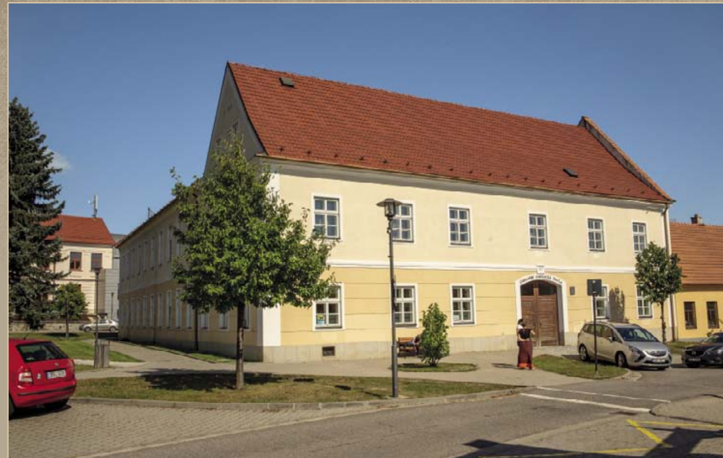
provozovalo město. V období městské správy se sem však záhy nastěhovala potřebnější pekárna, vojáci, obecní byty, špitál a v roce 1785 nakonec i škola. Vzdělávacím účelům budova, rozšířená přístavbou z roku 1878, slouží již více než dvě století. Kromě obecné a zvláštní zde těsně před rekonstrukcí v roce 1998 zakotvila základní umělecká škola.