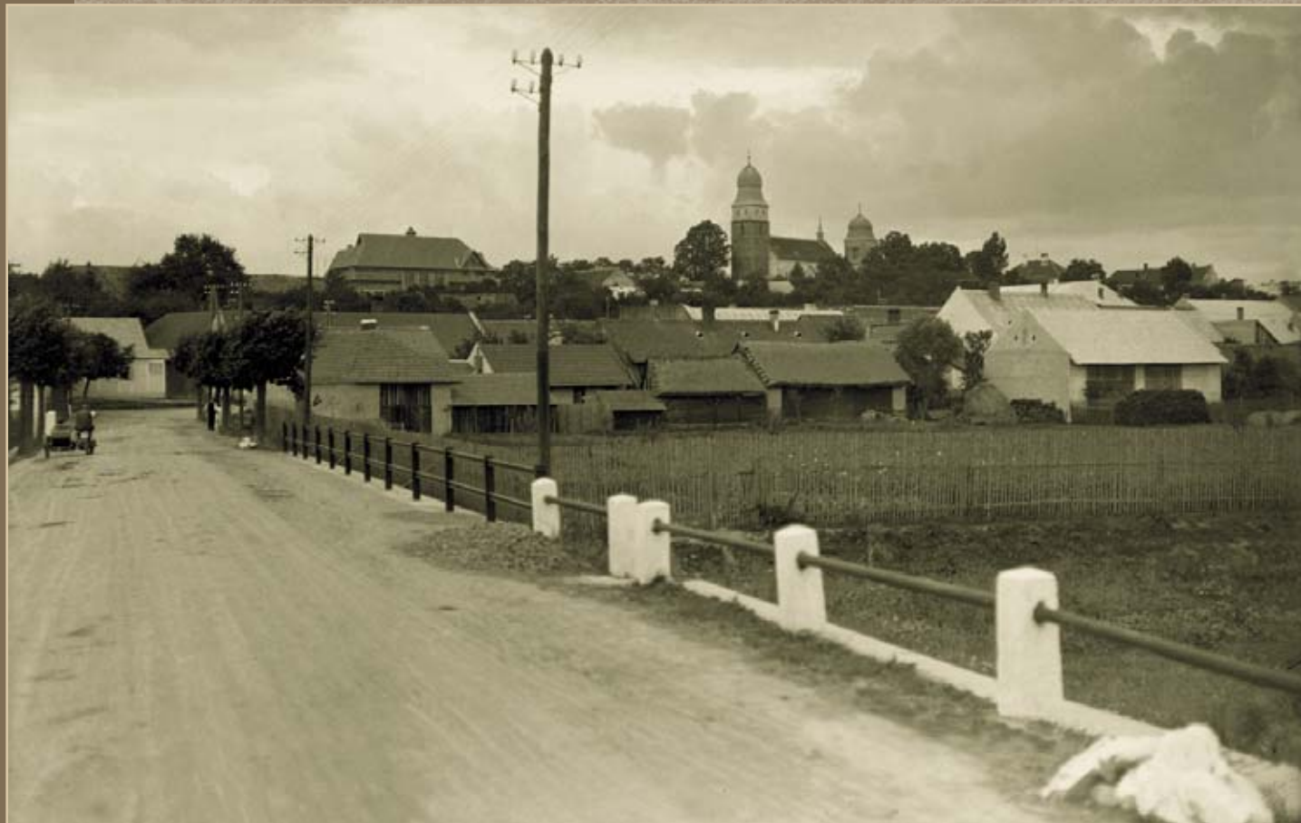
Pohled ke kdysi obávané křižovatce na konci Lánci tentokrát z tzv. meziříčského mostu. V jeho starším pojetí z konce dvacátých let 20. století zaujme, jak se na něm prolíná Bíteš historická zastupovaná pásem doškových stodol s Bíteší moderní reprezentovanou architektonicky neotřelou budovou sokolovny v nové