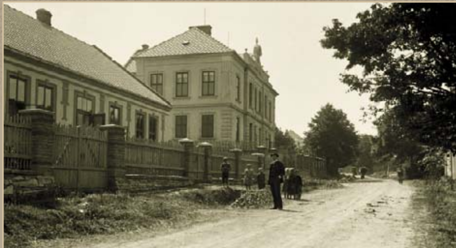
Pohled do Týřovské ulice z počátku 20. století naznačuje tři hlavní směry, jimiž se ve Velké Bíteši ubíral další stavební úvoj: budování nových ulic, stavba škol a bourání hospodářských stodol.

obratu nepochybně přispělo utvoření samostatného bítešského soudního okresu v roce 1892 a na něj navazující rozvoj vyššího všeobecného i odborného školství. Ruku v ruce s tímto vývojem zdejší křesťansko-rurální společnost začala postupně absorbovat emancipační i sekularizační trendy.