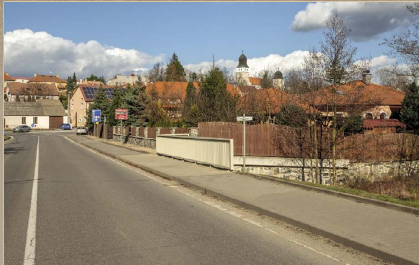
Tyršově ulici. Současnému pohledu na nový meziříčský most z roku 2006 dominuje především samotná komunikace I. třídy a spolu s ní i dnešní vliv a význam dopravy.