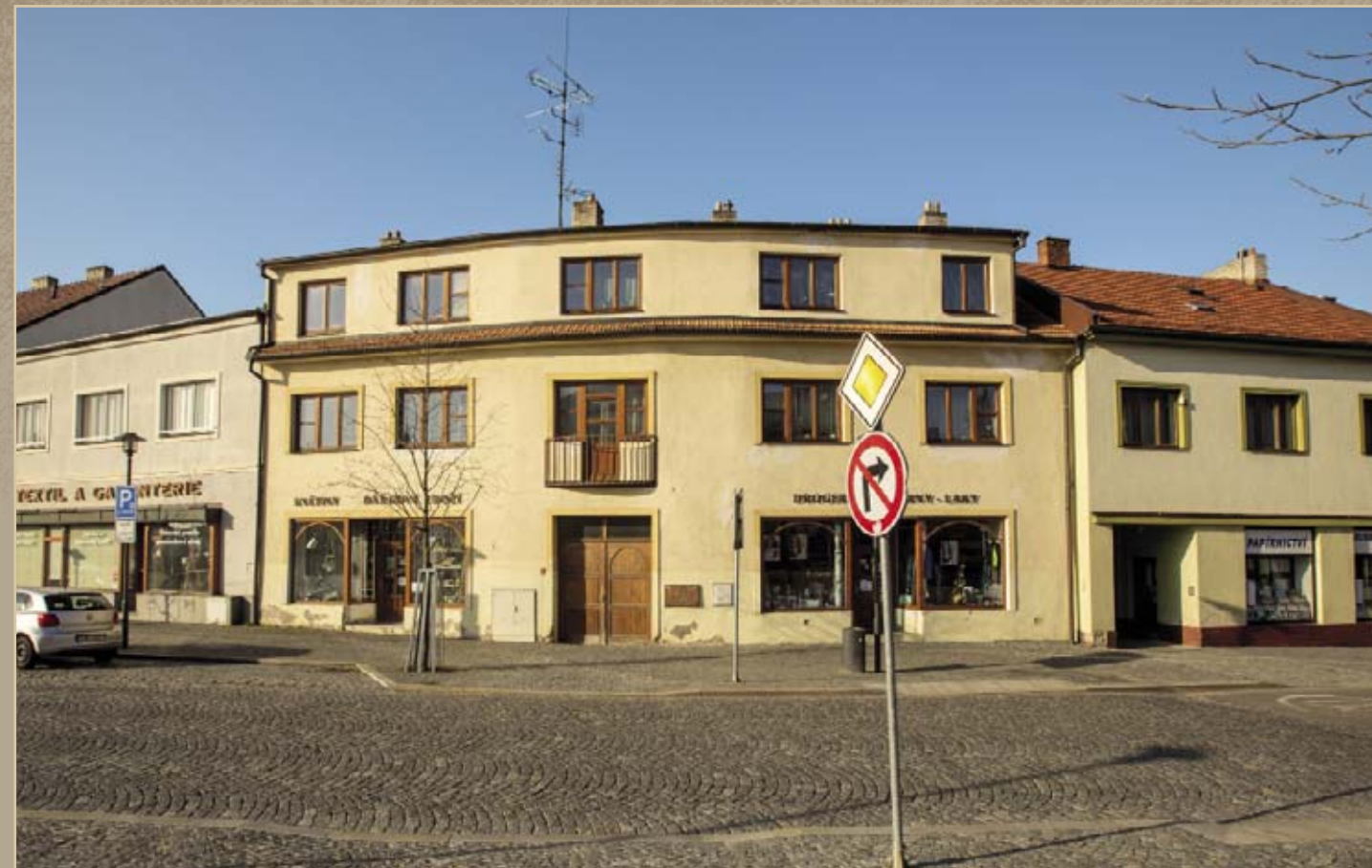
zde kromě židovského obchodníka Jakoba Weila sloužila také trojčlenná posádka bítešské četnické stanice. Dům po zásahu sousedního č. p. 17 leteckou pumou na konci druhé světové války vyhořel a během poválečné obnovy získal půdní patro. Dnes se zde nachází drogerie, prodejna květin a dárkového zboží.