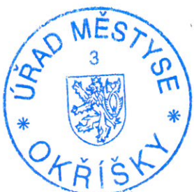
Milostná Jitka referent stavebního úřadu

Rozhodnutí má podle § 93 odst. 1 stavebního zákona platnost 2 roky. Podmínky rozhodnutí o umístění stavby platí po dobu trvání stavby či zařízení, nedošlo-li z povahy věci k jejich konzumaci.