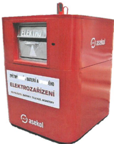
Vnější rozměry [vxšxh]: 1,9x1,35x1,45 m, hmotnost 800 kg