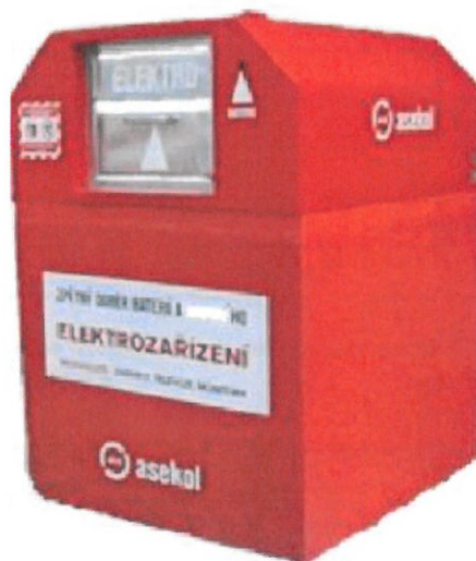
Vnější rozměry [vxšxh]: 1,9x1,25x1,35 m, hmotnost 1 300 kg