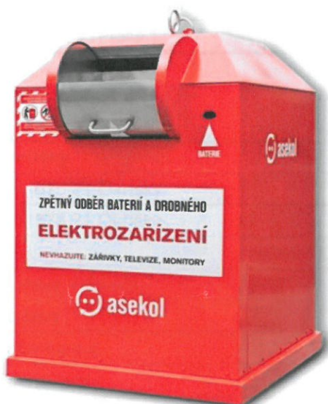
Vnější rozměry [vxšxh]: 1,8x1,2x1,45 m, hmotnost 290 kg

Povrchová úprava: Přelakováno barvou RAL 3020 (červená)