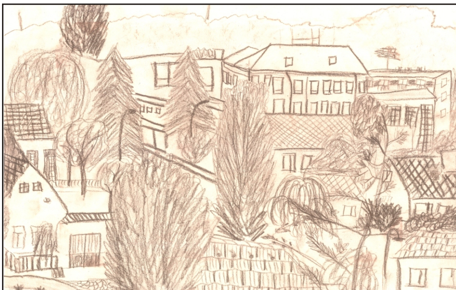
Druhé místo ve starší kategorii získal obrázek Pohled na Okříšky, autorka Jitka Švédová, 1. ročník stř. školy