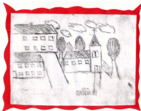
Návrh známky Kostel a zámek, Hana Kühtreiberová, 9. C