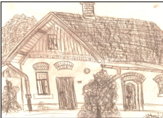
Autorkou obrázku domku je Aneta Krátká, 8. B

Tak co, líbil se vám tento příběh? Je jen na vás, jestli tomu uvěříte. Ale jedno mi věřte, lidská fantazie je nezkrotná. Žít bez fantazie, to není život !!!!!!!!!!!!!!!